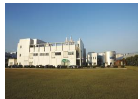
R&D Center (오창)